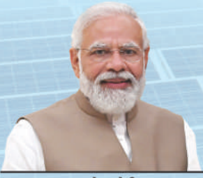
नरेन्द्र मोदी प्रधानमंत्री